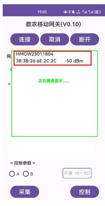
可连接网关列表图示

2) 点击 app 的连接按钮，出现网关连接列表，点击需要连接的网关，连接成功后会显示出相应的网关地址。